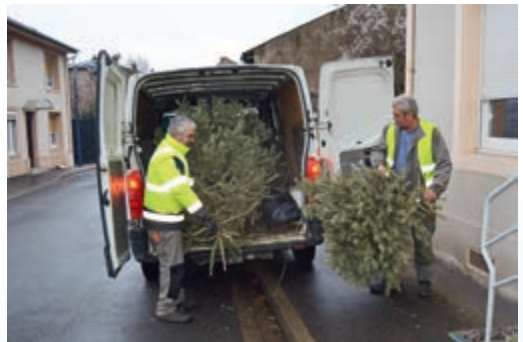
Les services municipaux ont assuré la collecte...

Menée pour la troisième fois consécutive, l'opération a encore connu cette année un beau succès avec plus de 150 sapins récupérés par les services techniques. Nous espérons que vous ferez encore mieux l'année prochaine et dépasserez les 200 spécimens !