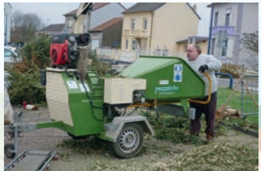
... puis le broyage !