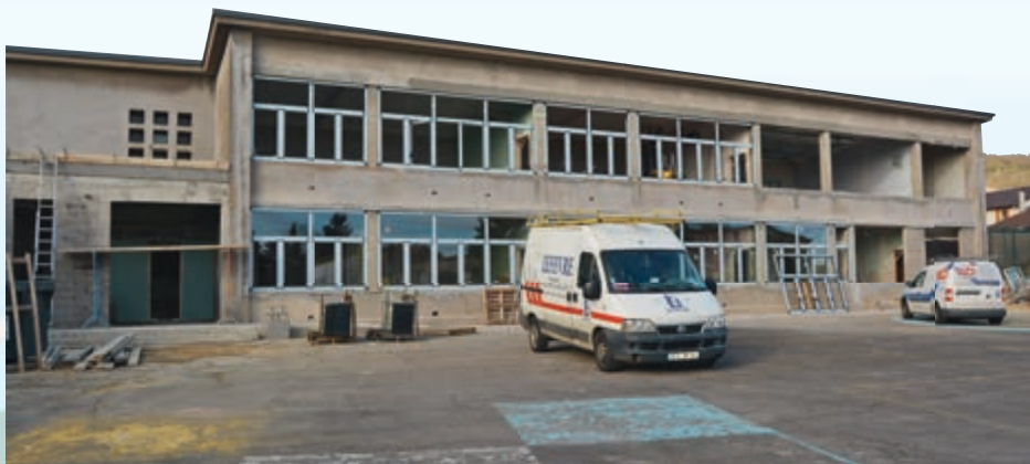
Vue sur la façade principale du bâtiment nord

Le chantier respecte pour le moment le calendrier prévisionnel et les petits Vitryens devraient pouvoir bénéficier d'un espace de qualité, comme prévu, en septembre prochain.