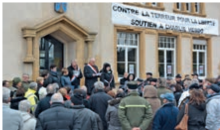
Le rassemblement à Vitry

des attentats. À l'appel du Maire, plus de 150 personnes se sont réunies devant la Mairie pour se recueillir un instant. Dans un même élan et en partenariat avec la commune de Clouange, un bus a également été mis en place pour les personnes souhaitant se rendre au rassemblement du dimanche 11 janvier à Metz qui a réuni près de 45 000 personnes.